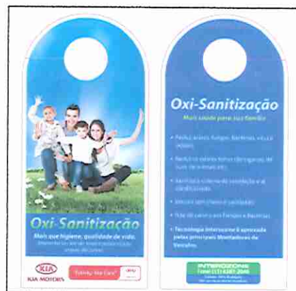
Cabide para retrovisor