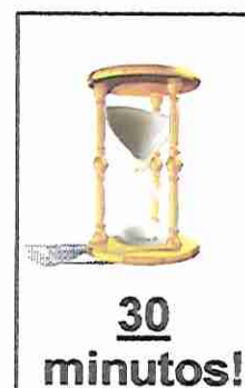
TEMPO DE APLICAÇÃO