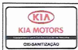
CARTÃO DE ACIONAMENTO